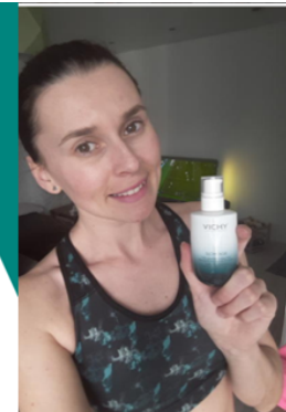
Dalšíjeen : švela konzistence a nadhera vona... - Vichy Slow Age